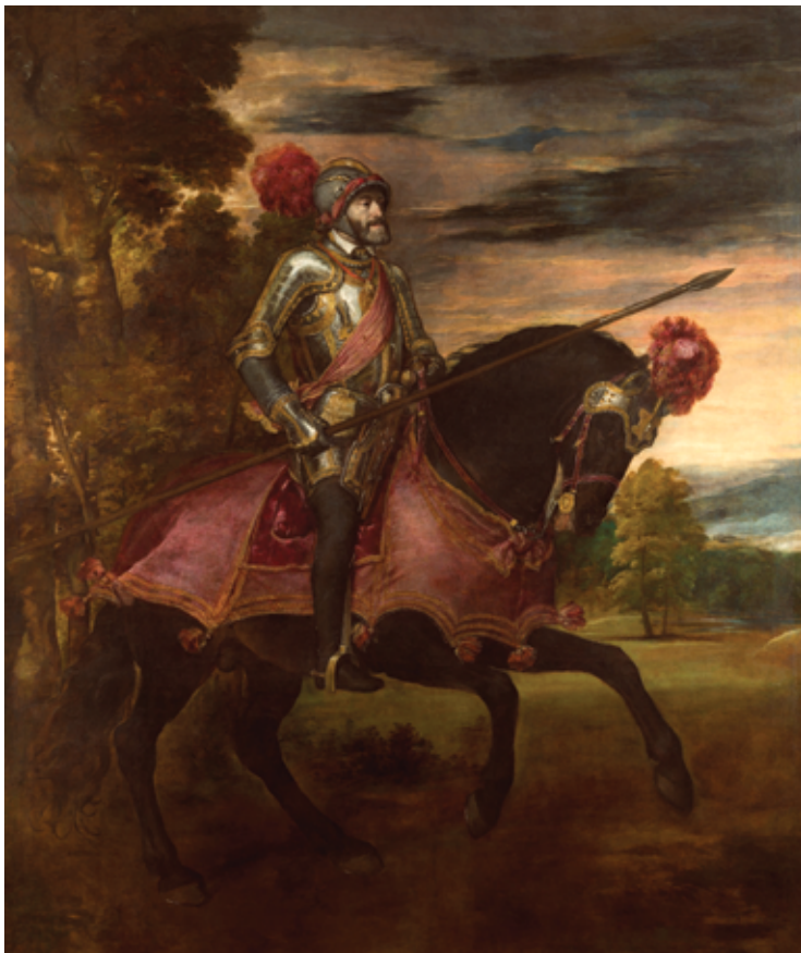
Tiziano, Carlos V en la batalla de Mühlberg , 1548. Museo Nacional del Prado, Madrid

DOMINGO 22 MAR, 12:00 LUNES 23 MAR, 12:00 Solistas Salvat Beca Bach y Bachcelona Consort. Diálogo entre siete arias de la Pasión según San Marcos de Bach y siete arias de Handel, que Bach incluyó en su interpretación en Leipzig en 1747.