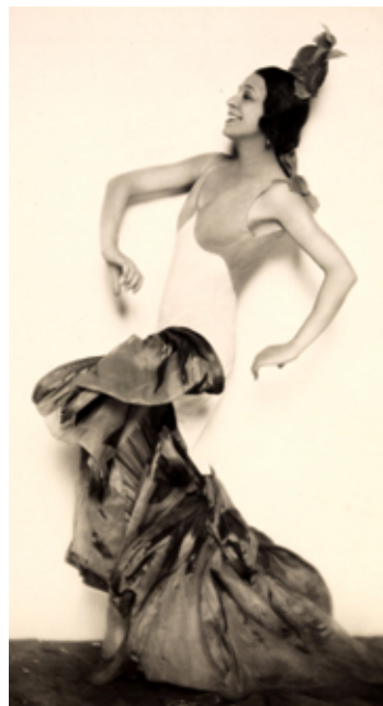
Arriba: representación de Juerga por parte de los Ballets Espagnols en el Théâtre Marigny de París, en junio de 1929. Abajo, “La Argentina” en tercera posición flamenca, vestida para Triana.