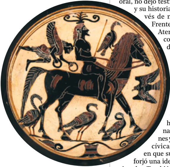
Arriba: copa (kylix) realizada en Esparta a mediados del siglo VI a. C. que probablemente representa a Nike, diosa de la victoria. Museo Británico, Londres