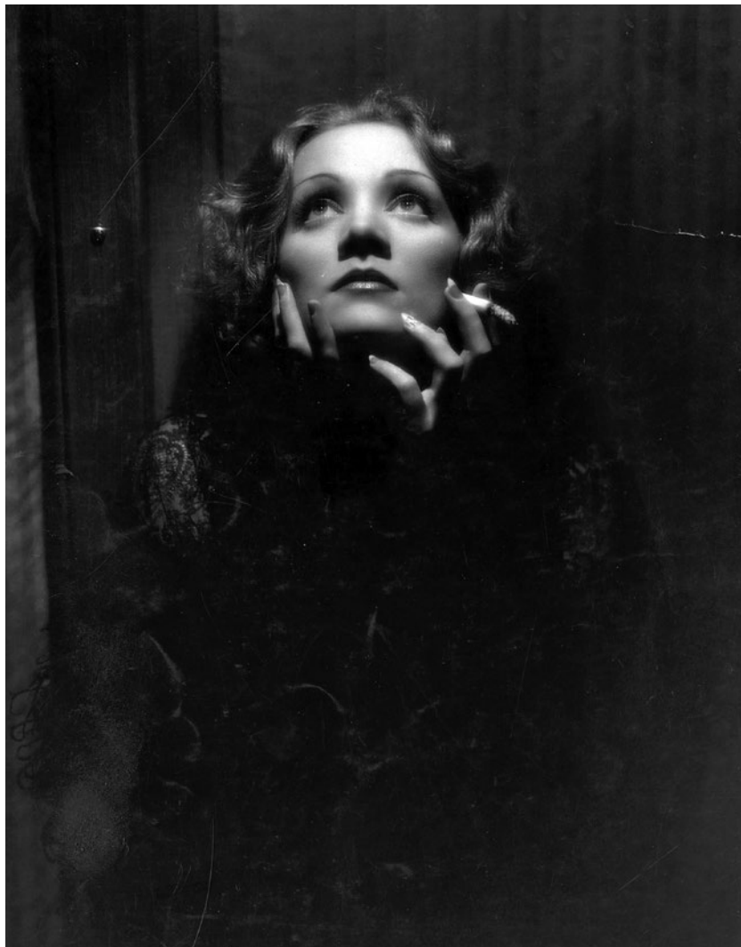
Marlene Dietrich en El expreso de Shanghai , programada el 30 y 31 de enero en el ciclo Romance y transgresión en el Hollywood Pre-Code