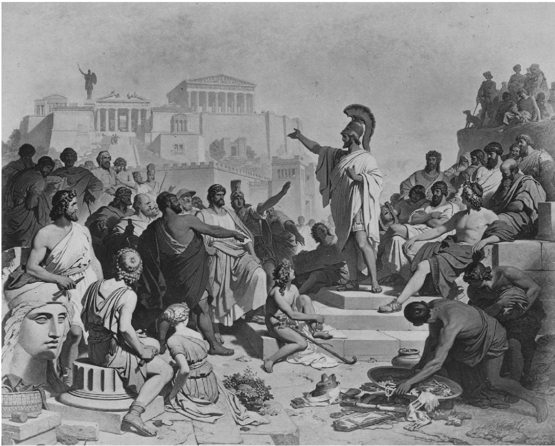
Reproducción fotográfica del cuadro El discurso fúnebre de Pericles de Philipp von Foltz, Rijks Museum, Ámsterdam